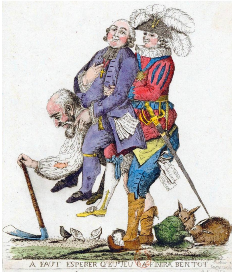
Խորագիր՝ Հուսանք, որ շուտով սա կավարտվի:

Ծաղրանկարը տպագրվել է 1780-ականներին և մեկնաբանում է այն ժամանակ ֆրանսիայում տիրող հասարակության կառուցվածք՝ իր երեք դասերով: